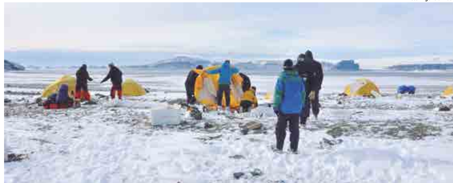
Equipe de cientistas argentinos está usando microrganismos nativos da Antártica para limpar a poluição de combustíveis e plásticos

Os pesquisadores coletam amostras de plástico dos mares da Antártica e estudam para ver se os micro-organismos estão comendo os plásticos ou simplesmente os usando como jangadas.