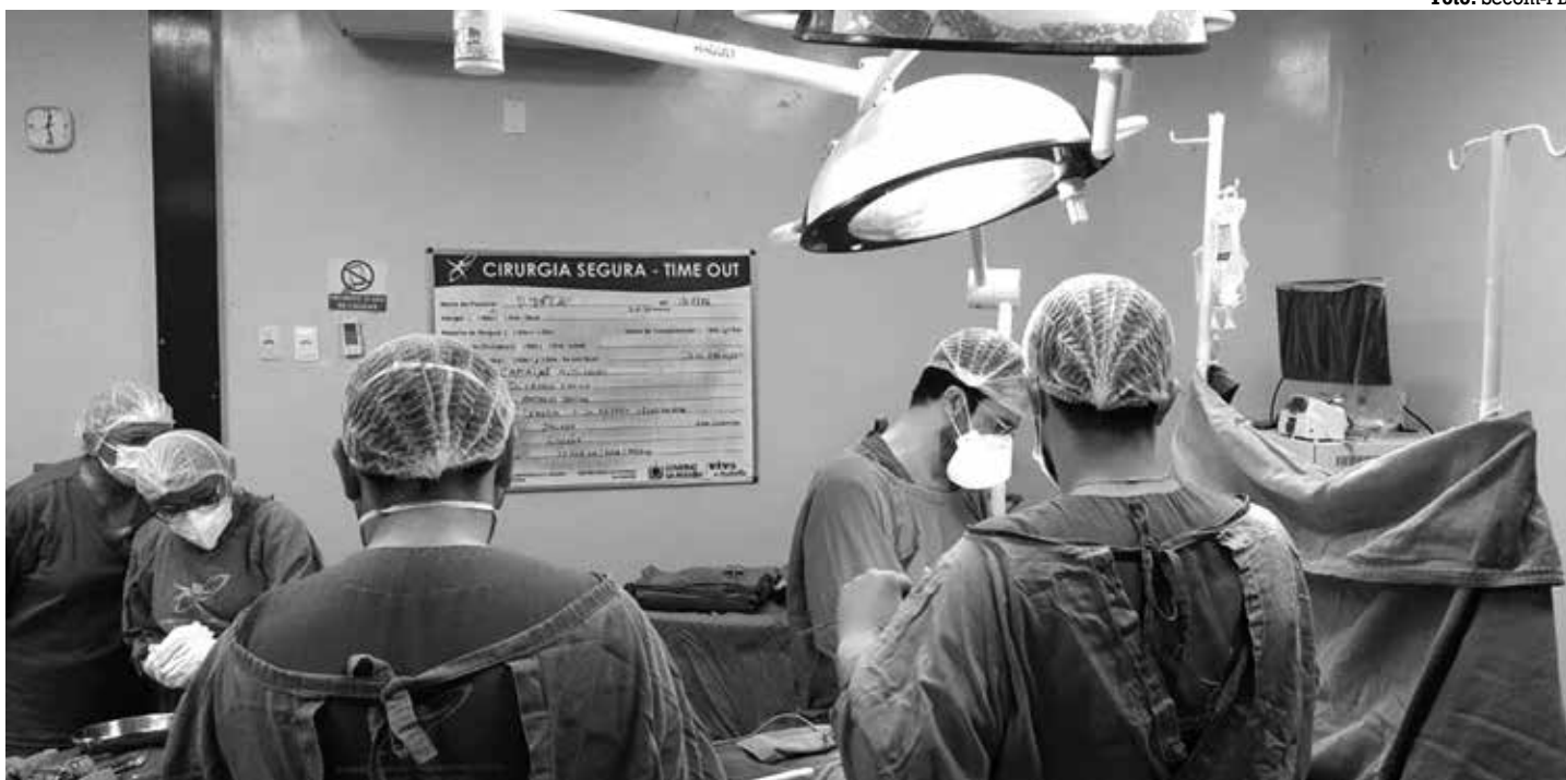
Foram captados do doador de 20 anos que estava internado no Hospital de Trauma, de João Pessoa, o fígado, os rins e as córneas

O surto de gripe registrado em João Pessoa é resultado da nova cepa da influenza, batizada de H3N2 Darwin