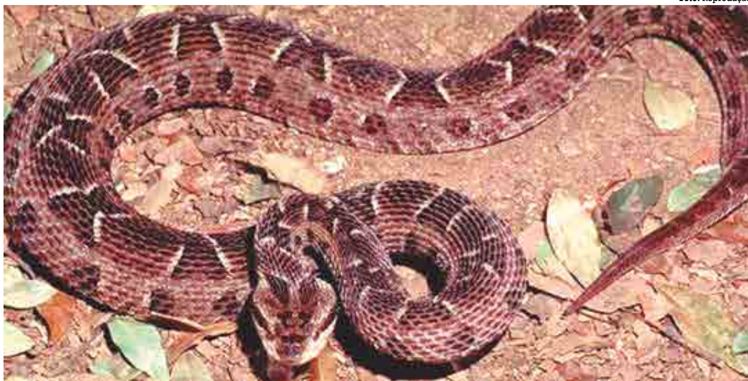
As picadas por cobras também compõem os casos mais graves por animais peçonhentos detectados no HULW de João Pessoa

Conforme o professor, se a pessoa já tiver uma doença de base o seu estado pode piorar muito rápido, assim como em pessoas mais idosas ou crianças. “Dependendo da serpente, o veneno tem características específicas. A jararaca, por exemplo, você pode ter alteração de coagulação. E se a pessoa já toma remédio para evitar formação de trombo pode ter risco de sangramento. Pacientes com problemas renais podem se agravar”, detalhou.