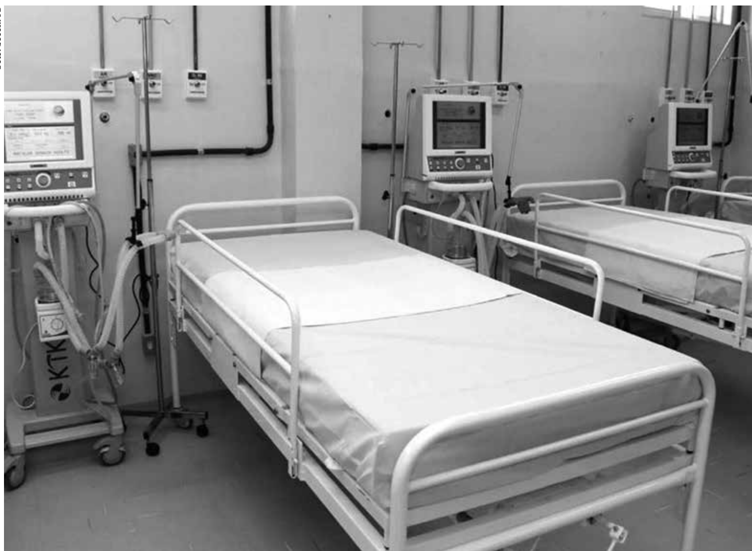
HC havia zerado, em dezembro, a ocupação de leitos para pacientes com Covid-19, mas reativou leitos para atender o aumento da demanda

“Nos últimos dias, nós temos visto um aumento considerável na taxa de ocupação e também no número de regulações para o HC, sendo a grande maioria dos pacientes idosos.