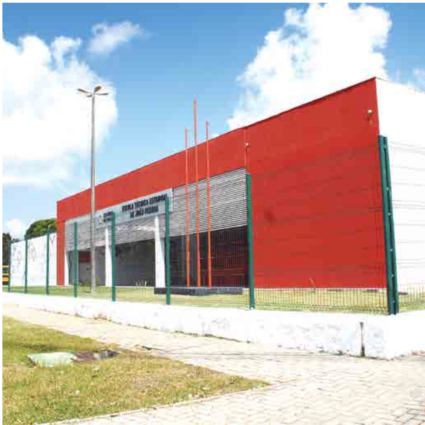
Rede de Ensino da Paraíba possui 302 Escolas Cidadãs Integrais e o planejamento é implantar mais 25 unidades este ano