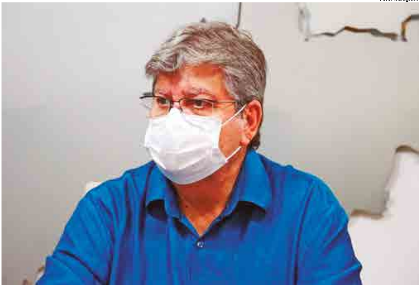
João Azevêdo recebeu a terceira dose da vacina contra Covid-19 em outubro do ano passado; “vacinas salvam vidas”, postou nas redes sociais

■ Essa é a primeira vez que o governador testa positivo contra a Covid-19; ele alerta sempre que a vacina salva vidas