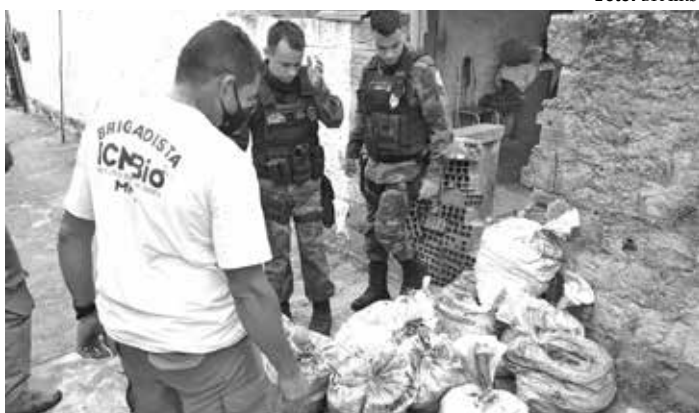
Os caranguejos-ucá foram apreendidos na cidade de Caaporã

irregular dos animais naquela região. Além da apreensão dos crustáceos foram lavrados autos de infração em desfavor dos infratores, totalizando cerca de 41 mil reais em multas.