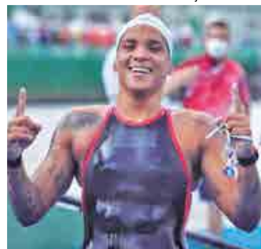
O Troféu Ana Marcela, a ser disputado, é uma homenagem à medalhista olímpica