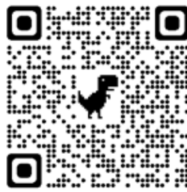
Através do QR Code acima, acesse o site da Pod360

O podcast estará disponível nas plataformas Spotify, Amazon, Google, Deezer e Apple.