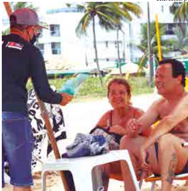
Será feito um trabalho de conscientização sobre descarte de resíduos

O trabalho de educação ambiental do programa Amigos da Praia será feito no Bessa, hoje e amanhã, a partir das 9h. A concentração será no Caribessa, de onde as equipes de agentes ambientais partirão para fazer um trabalho de conscientização sobre o correto descarte de resíduos. A ação será feita em parceria pela Autarquia Especial Municipal de Limpeza Urbana (Emlur) e a Secretaria de Meio Ambiente (Semam), que vai distribuir mudas de árvores nativas, orientando a população sobre a forma correta de se fazer o plantio.