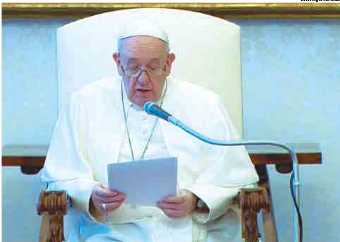
O papa Francisco propôs à humanidade caminhar junta, ressaltando que “ou somos irmãos ou tudo desaba”

■ O pontífice fez a afirmação em mensagem enviada a participantes de mesa-redonda realizada na Expo Dubai 2020