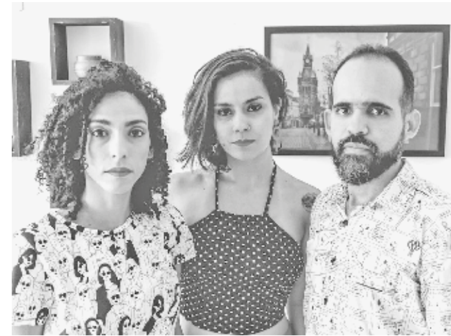
Banda Gatunas se apresenta amanhã, no Café da Usina