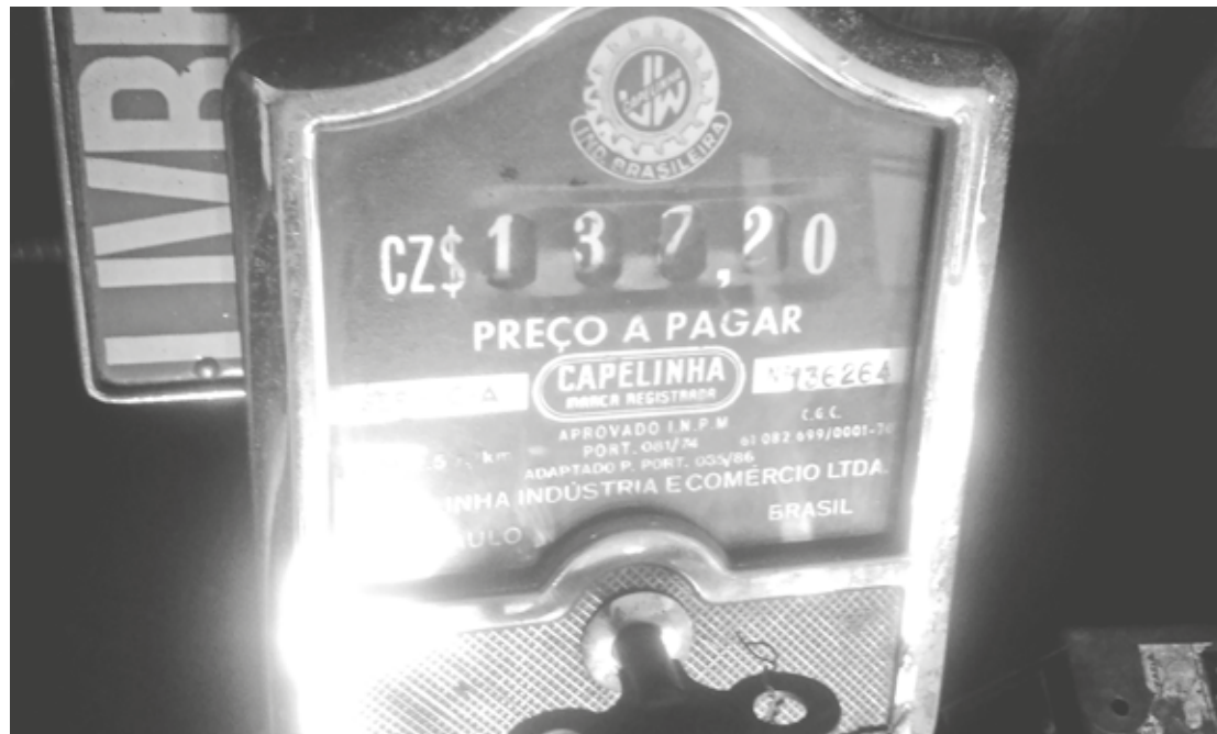
Um tanto antigo